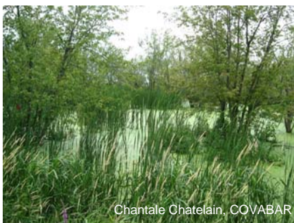
Milieu humide de la rivière du Sud