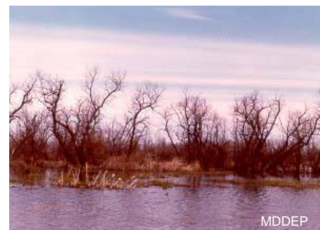
Réserve naturelle de la rivière du Sud